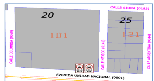
MEGA MERCADO MUNICIPAL