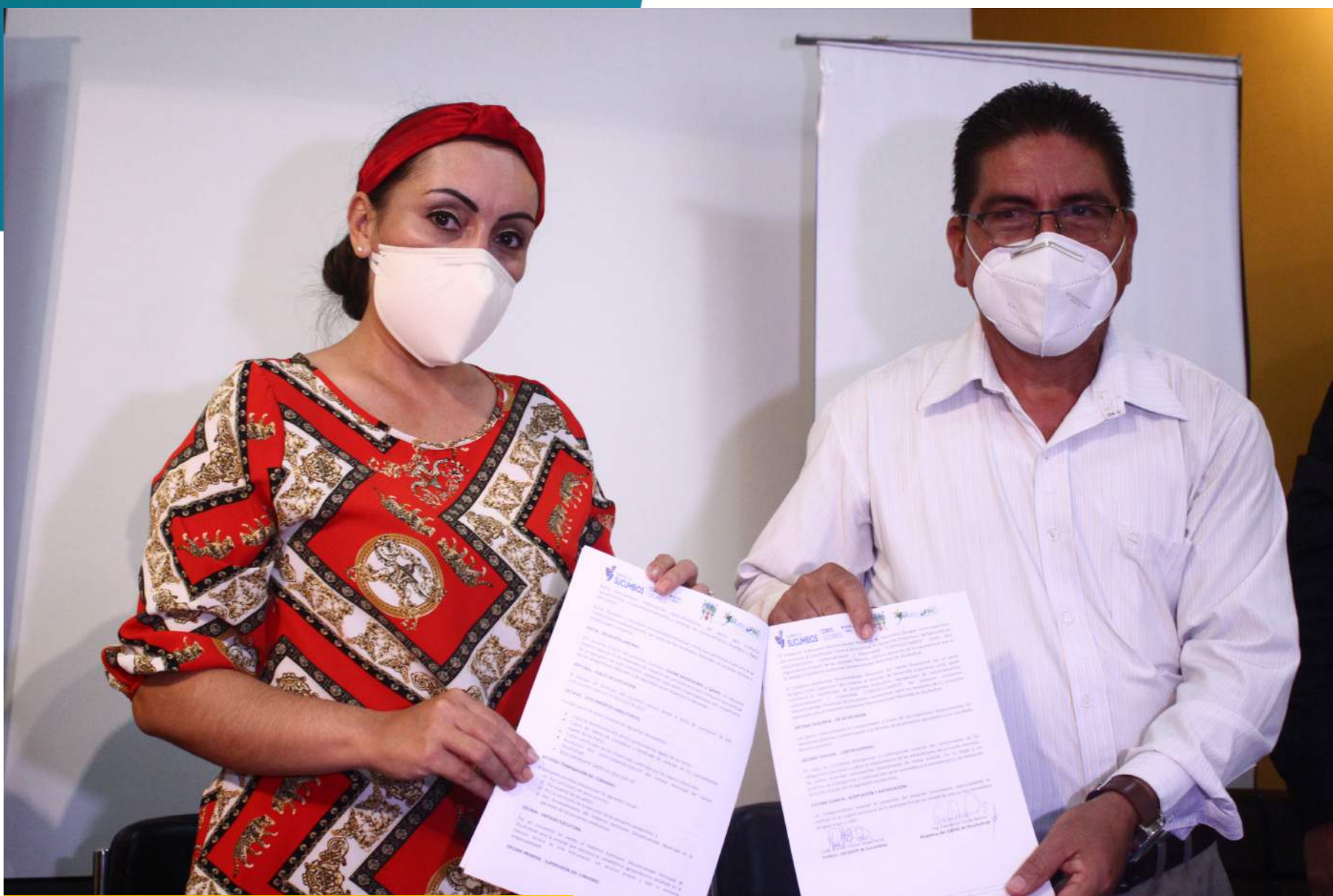
Firma de convenio entre el GAD Municipal y Gobierno Provincial para la Delegación de Competencias en FOMENTO PRODUCTIVO.