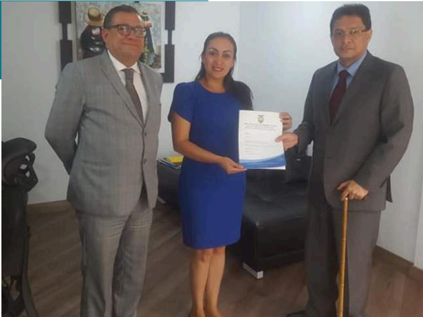
ENTREGA DE TERRENOS AL MIDUVI PARA LA IMPLEMENTACIÓN DEL PLAN CASA PARA TODOS EN SHUSHUFINDI